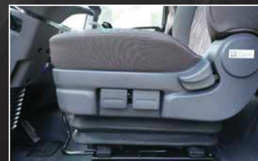
Ghế lái cân bằng hơi, tùy chỉnh điện, thoải mái khi lái xe