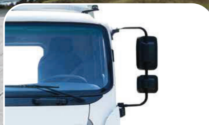
Hệ thống gương chiếu hiện đại hạn chế điểm mù, chỉnh gương hậu bằng điện