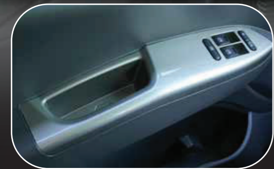
Kính chỉnh điện