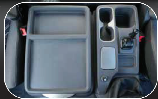
Khay để đồ rộng rãi, tiện lợi