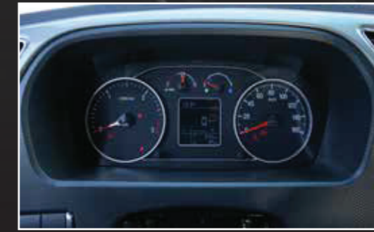
Đồng hồ điều khiển hiện đại, kết hợp màn hình LCD