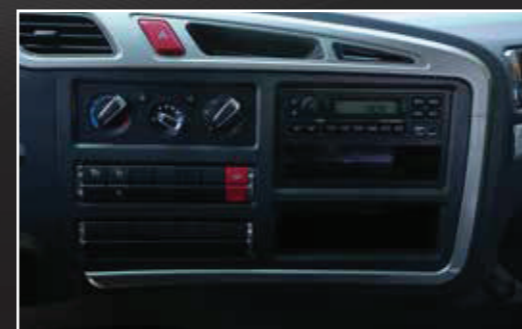
Bảng điều khiển thiết kế thẩm mỹ, hiện đại