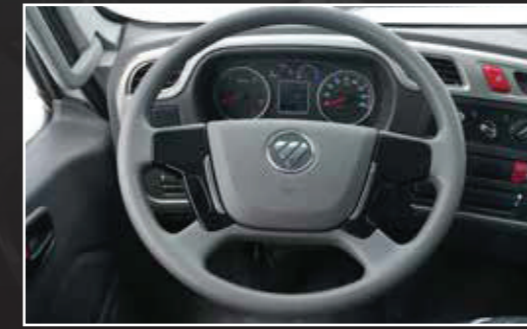
Vô lăng 4 chấu tích hợp còi Tay lái gạt gù, chỉnh 4 hướng