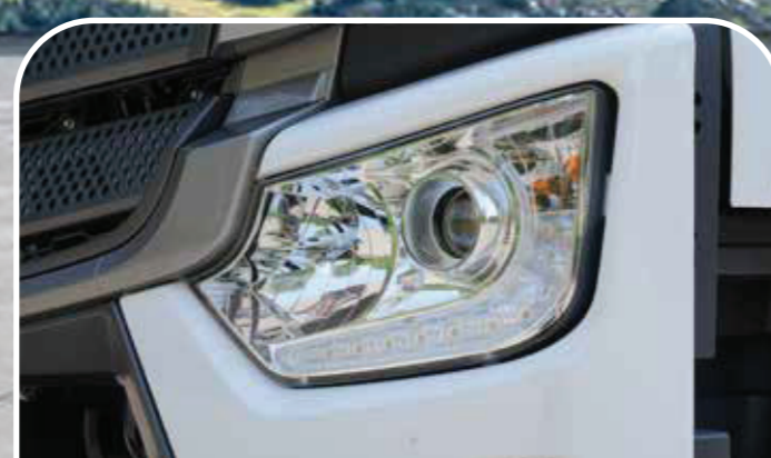
Cụm đèn pha Projector Cường độ sáng cao, tích hợp led ban ngày